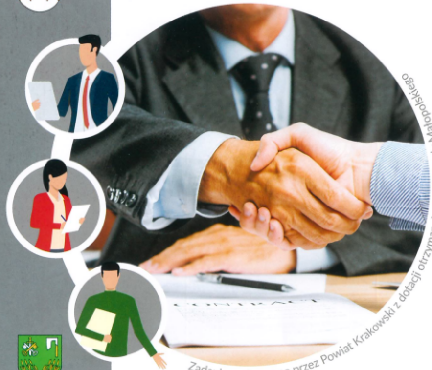
Zadanie realizowane przez Powiat Krakowski z dotacji otrzymanej od Wojewody Małopolskiej